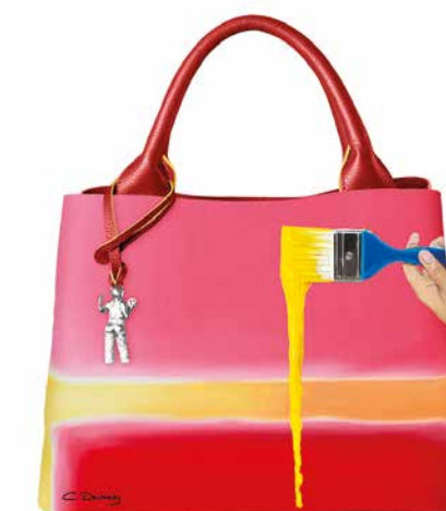
SAC A MAIN « ROTHKO » Impression sur cuir de veau, édition limitée, 100% fait main en Italie