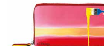
WALLET « ROTHKO » Impression sur cuir de veau, édition limitée, 100% fait main en Italie