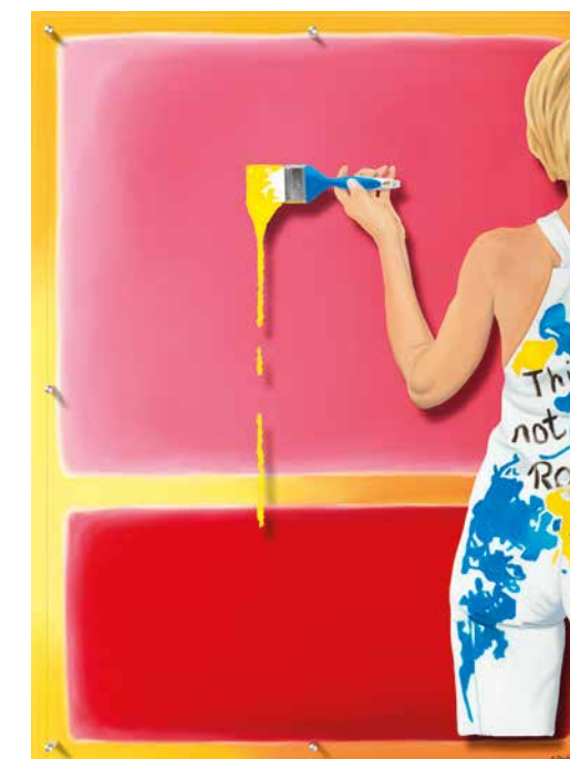
TABLEAU « L'ÉTÉ », 2020 Huile sur toile et plexiglas, pièce unique, 120x90cm